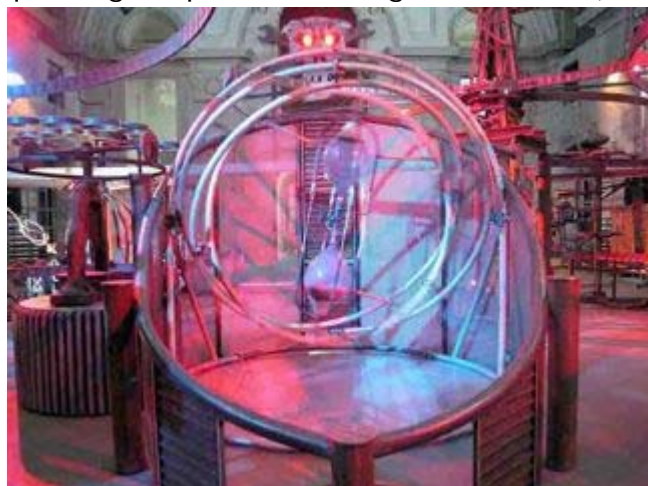
Mutoid Waste Company, Il Tempio metalmeccanico. La macchina del tempo, 2002-2003, particolare dell'allestimento presso la Cavallerizza Reale di Torino, 2003.