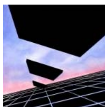
Michel Guéranger, Space, 1975, olio su tela, cm 90x90. Collezione dell'artista.