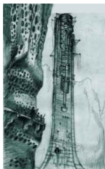
Tullio Rolandi, La fortezza di ferro, 2006, schizzo a matita, cm 21x15